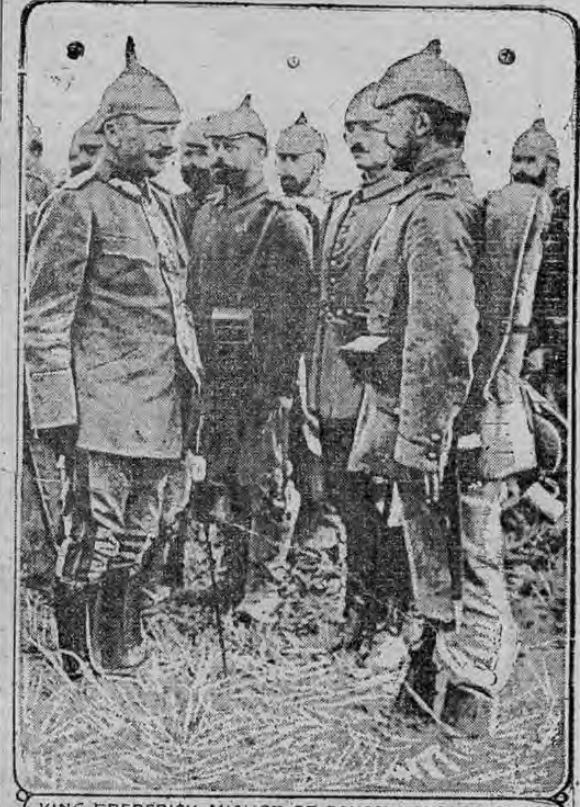
KING FREDERICK AUGUST, OF SAXONY, AND SOLDIERS

EL REY DE SAJONIA, QUE FIELMENTE AYUDA AL KAISER VISTO EN EL CAMPO DE OPERACIONES AL LADO DE LAS TROPAS