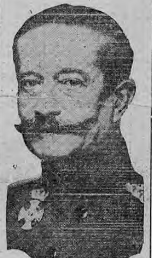
GENERAL VON BISSING

El General Moritz von Bissing es el nuevo Gobernador de Bélgica. Ha ocupado su puesto en sustitución del General Colmar von der Goltz, quien primeramente fue nombrado, pero ha sido recientemente enviado a Turquía. El General von Bissing tiene 66 años de edad y es veterano de la guerra de 1866.