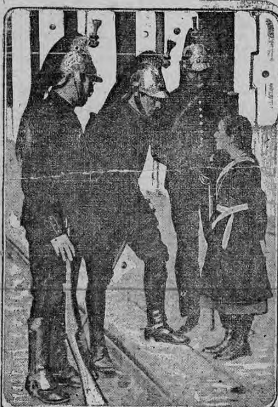
LITTLE PARIS HEROINE TELLS THE SOLDIERS HER STORY

UNA CRIATURA DE PARIS, VICTIMA DE UNA BOMBA AEREA DE LOS ALEMANES, CUENTA SU HISTORIA A ALGUNOS SOLDADOS QUE COMPADECIDOS LA ESCUCHAN